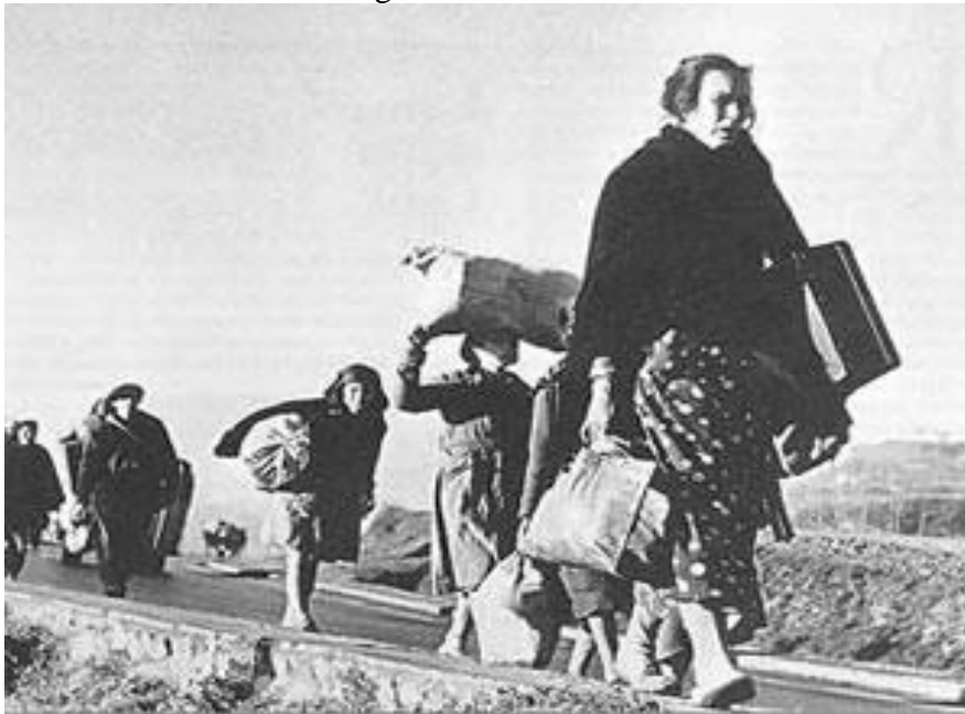
Fotografía de Robert Capa de un grupo de españoles camino del exilio a Francia.

FUENTE HISTÓRICA: Relacione esta fotografía con el exilio durante la dictadura franquista.