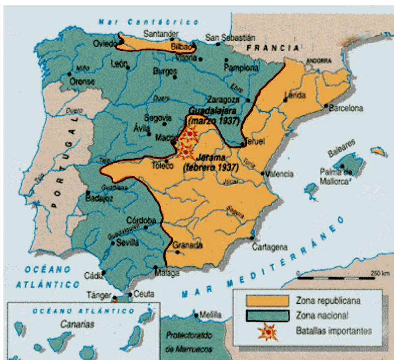
La guerra civil española: situación del frente en marzo de 1937.

FUENTE HISTÓRICA: Relacione el mapa siguiente con el desarrollo de la guerra civil española.