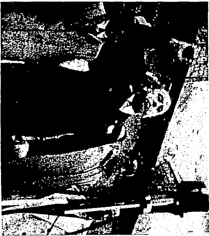
José María Gil Robles interviene en un acto electoral.

Decidió luchar dentro de la Segunda República, porque no le pareció necesario defender la monarquía ni recurrir a la violencia. Se aglutinó en torno a Acción Popular (1932), núcleo de lo que sería la Confederación Española de Derechas Autónomas o CEDA (1933), un auténtico partido de masas de la derecha posibilista o accidentalista (con respecto al tipo de régimen). Pretendía aplicar su programa y reformar la Constitución sin abolir la República. Su líder, José María Gil Robles, era partidario de instaurar un régimen corporativo y autoritario (no liberal) y de restablecer todo el poder político y económico de la Iglesia. Contaba también con una organización juvenil, las Juventudes de Acción Popular (JAP), que se acercaron al fascismo en los meses previos a la Guerra Civil.