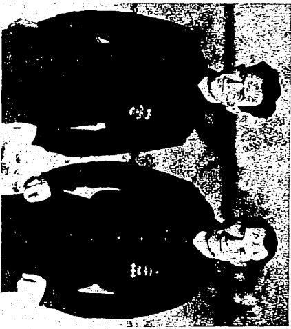
Onésimo Redondo (izquierda) y José Antonio Primo de Rivera (derecha).

Ambos grupos se unieron para constituir FE de las JONS (1934), una reducida asociación de extremistas, partidarios de la violencia contra el movimiento obrero y las instituciones republicanas, que fue financiada por los monárquicos para que desestabilizaran el régimen (Pacto de El Escorial). La importancia de este partido aumentó durante la Guerra Civil porque se convirtió en la plataforma política del régimen franquista.